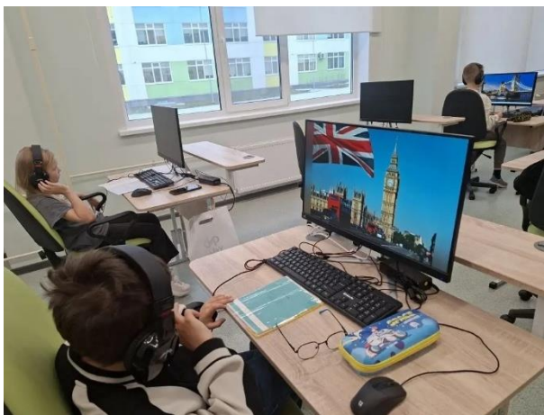
Учить английский можно весело